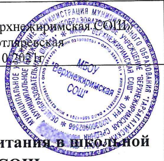
График родительского контроля за организацией питания в школьной столовой в МБОУ «Верхнежиримская СОШ»